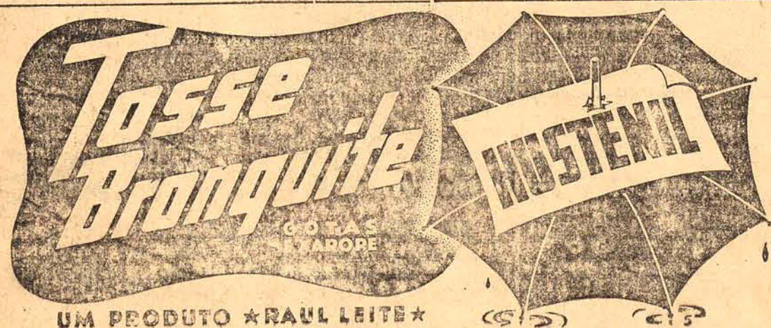
UM PRODUTO *RAUL LEITE*

Chegarão as Grandes novidades de Inverno para A Modelar Artigos para senhoras, homens e crianças.