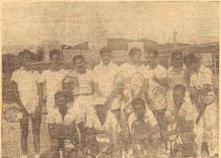
UM GRUPO DE NOVAS TENISTAS DO LIRA TENIS CLUBE FLORIANOPOLIS