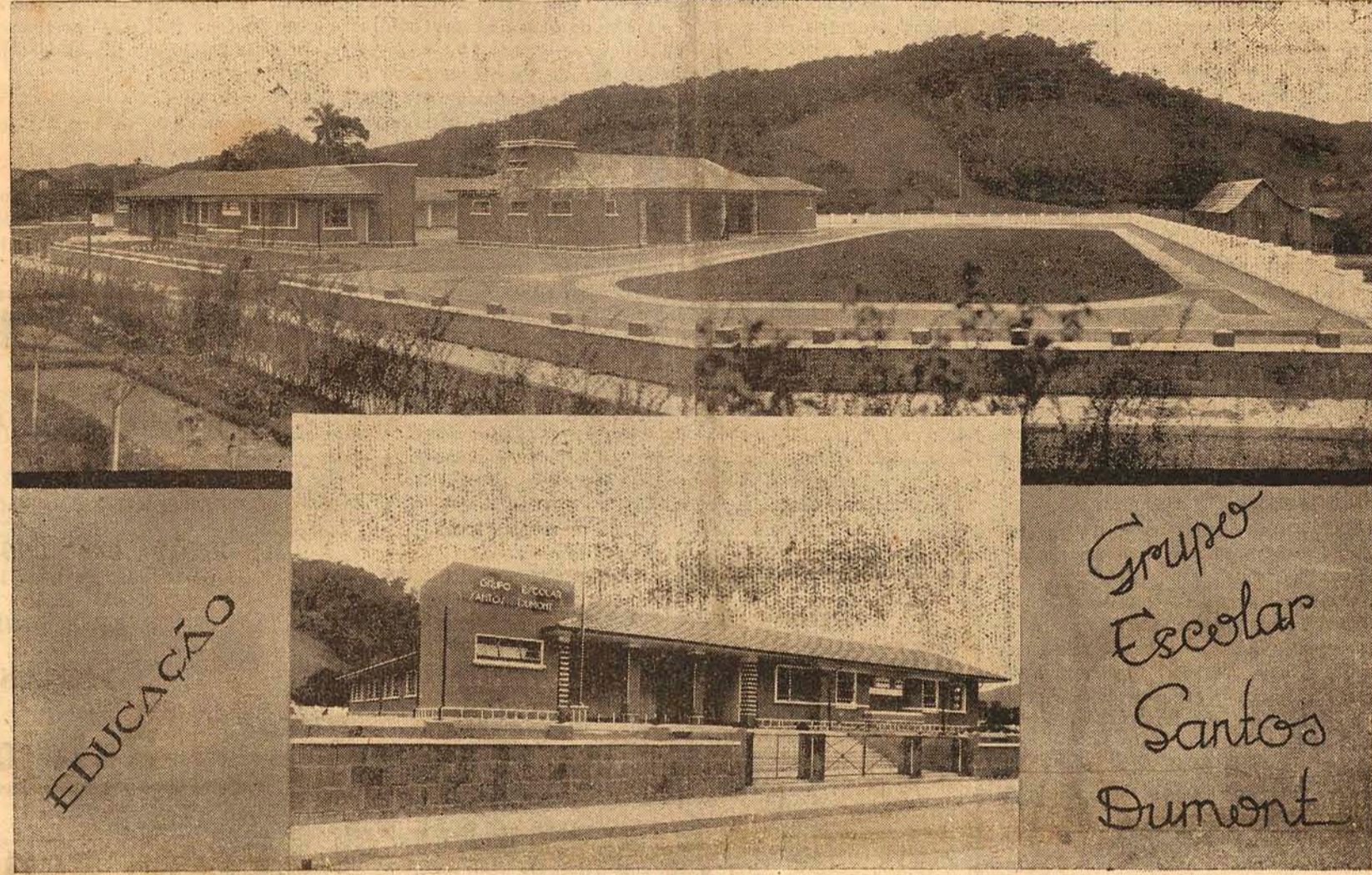
Getúlio Vargas, no Saco dos Lameões; cozinhas diéticas do Departamento de Saúde Pública; o Centro de Saúde de Joinville e o Grupo Escolar "Rui Barbosa", da mesma cidade; o Grupo Es-

Sómente em 1940, foram concluídas e inauguradas as seguintes obras: residência da Diretoria de Estradas de Rodagem em Lajes e o novo pavilhão do Hospital de Caridade da mesma cidade; o Departamento de Saúde Pública, nesta capital, a Colônia Santa Terêsa, o Abrigo de Menores e o novo pavilhão da Penitenciária do Estado; o Grupo