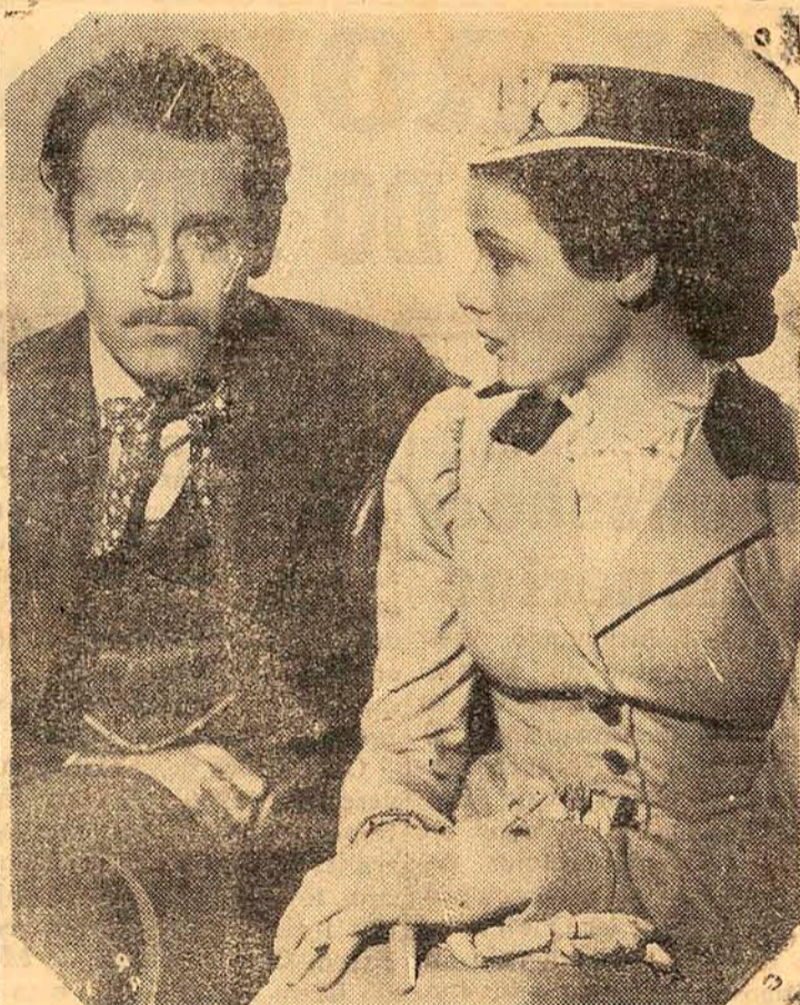
HENRY FONDA e GENE TIERNEY

Na super-produção em 'TECNICOLOR' da "20TH CENTURY FOX"