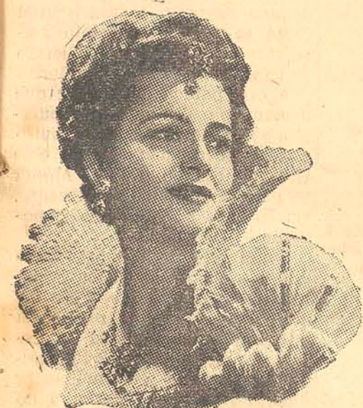
OLIVIA DE HAVILLAND