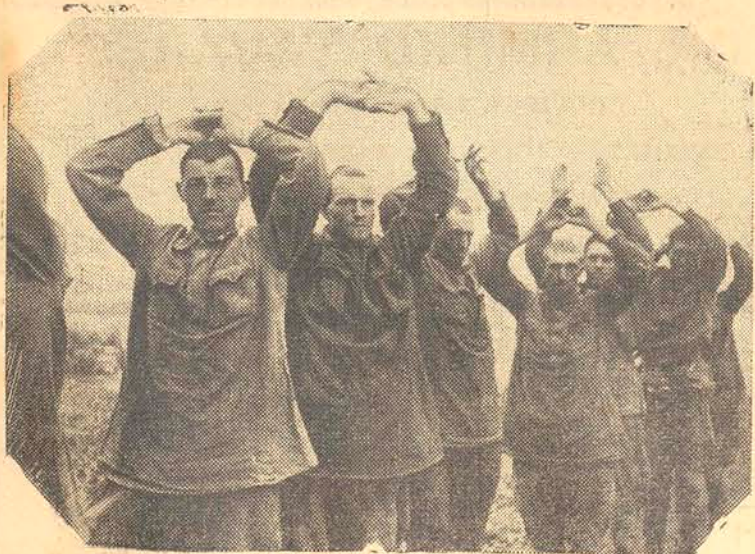
Soldados inimigos feitos prisioneiros pelas tropas alemãs.

Estará hoje de plantão a Farmacia "Santo Agostinho", á rua Conselheiro Mafra.