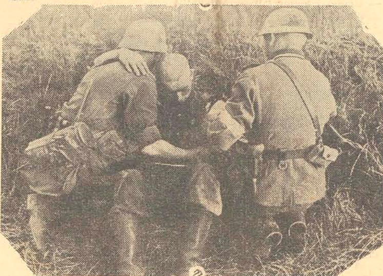
Um soldado inimigo no "front" do leste sendo socorrido por soldados alemães.

ANO VIII Florianópolis, domingo, 7 de Setembro de 1941 NUMERO 2126