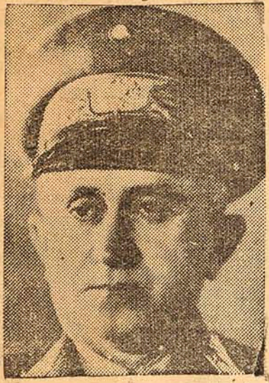
MINISTRO EURICO GASPAR DUTRA

“A campanha nacional em prol da aviação civil é um empreendimento digno de todos os encômios. Nascida instintivamente da necessidade de aumentarmos nosso poder aéreo, empolgou a opinião pública; atraíu a imprensa brasileira, tão generosa e cheia de ardor cívico, quanto solícita em dispender esforços e fazer sacrifícios”