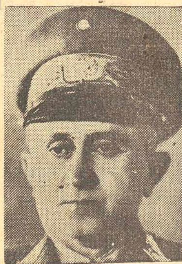
Gal. Gaspar Dutra