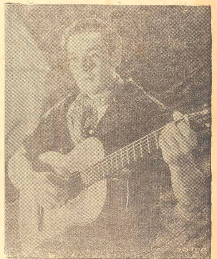
TITO GUIZAR em uma cena do filme

Com a apresentação para muito breve de "QUANDO A LEI CANTA" novíssimo filme de TITO GUIZAR, a EMPRESA "REAL CIRCUITO CINEMATOGRAFICA LTDA", proporcionará a todos admiradores do ator e cantor Mexicano, um espetáculo que entusiasmará certamente a todos. Segundo impressões recolhidas nas cidades americanas onde o filme já foi exibido, a maioria do publico aplaude "QUANDO A LEI CANTA" por duas razões, das quais somente uma nos interessa: é que TITO GUIZAR nos aparece neste filme caracterizando um personagem que, sem ter nada de comum com nenhum dos dois, guarda estreita semelhança com aqueles que interpretou em "Alá em El Rancho Grande" e "AMAPOLA DO CAMINHO", filmes que foram, respectivamente, o que revelou TITO GUIZAR como ator e o que o consagrou de maneira definitiva como tal. "QUANDO A LEI CANTA", salienta-se não só pelo maior interesse, variedade e riqueza dramática de sua ação, como também pela circunstancia de aparecer TITO GUIZAR, durante todo o desenrolar do entrecho, com um ator que se mostra perfeitamente ingrado no seu papel e dono de todos os seus recursos de sua arte.