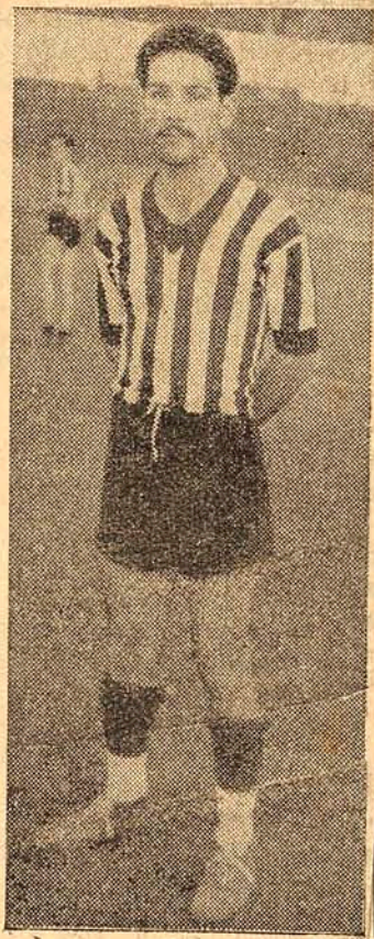
PE' DE FERRO, O DESTAQUE DO ZAGUEIRO ALVI-NEGRO

O 2º goal foi conquistado aos 16 minutos da fase, por inter-