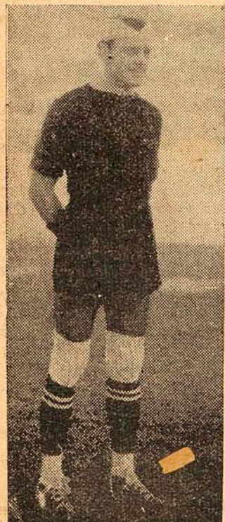
VADICO, QUE COM GALHARDIA, DEFENDEU A CIDADELA SOB A SUA GUARDA.

A grande assistência que ocorreu na tarde de ante-onTEM ao Stadium Adolfo Konder, para presenciar o tradicional encontro entre os mais antigos clubes da capital deve ter saído satisfeita, pois presenciou um encontro de grande movimentação, disputado com muito ardor, onde a disciplina não foi quebrada os 22 preliantes portaram-se como verdadeiros esportistas, uma outra entrada mais brusca, dado ao entusiasmo na