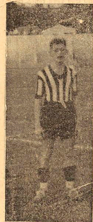
FORNEROLI, QUE FEZ UMA ÓTIMA PARTIDA.

BIGUA' — que grande jornada, para o esguio médio alvi-