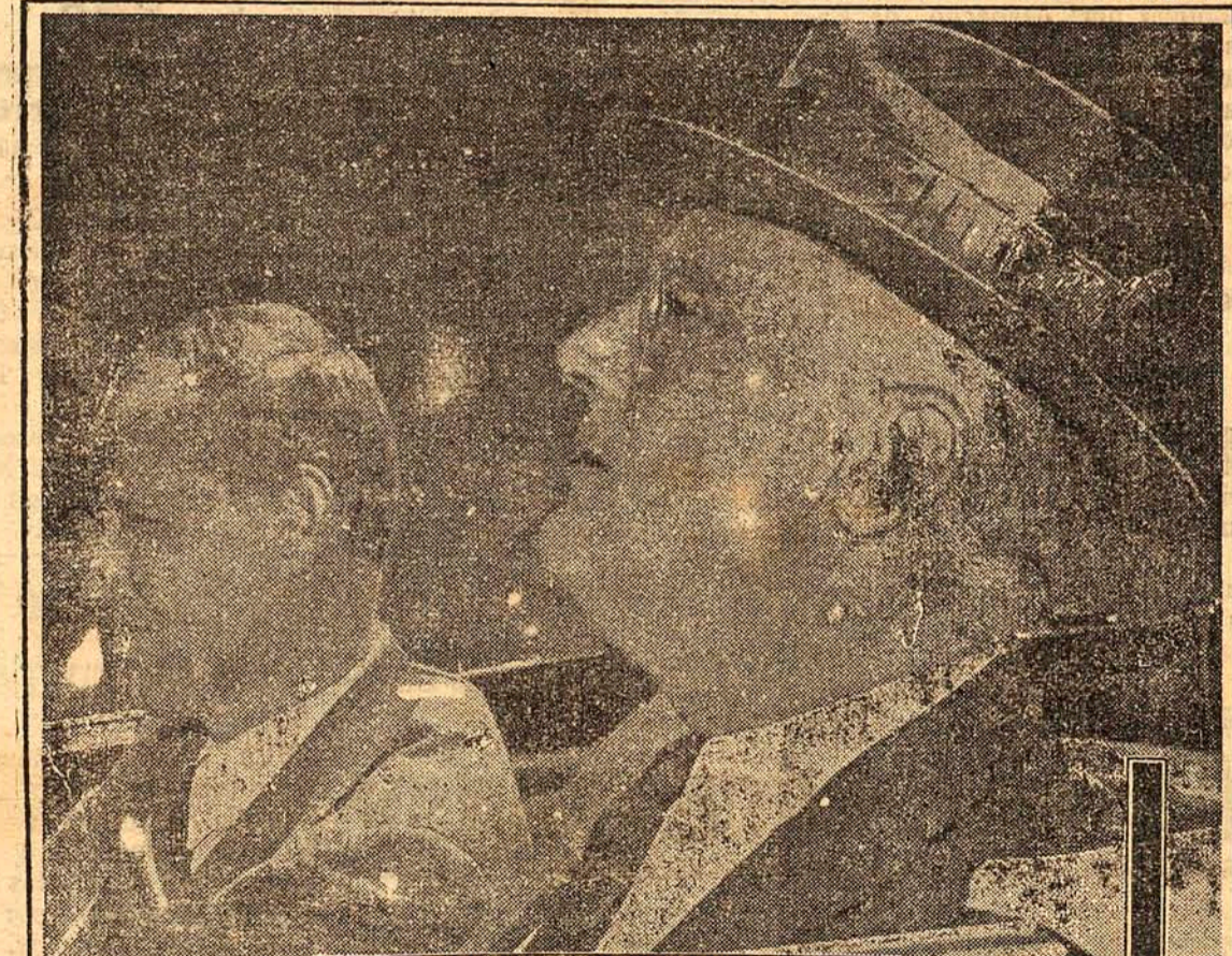
Harry Hopkins e o Presidente Roosevelt

Declara o sr. Harry Hopkins, auxiliar imediato do Presidente Roosevelt.