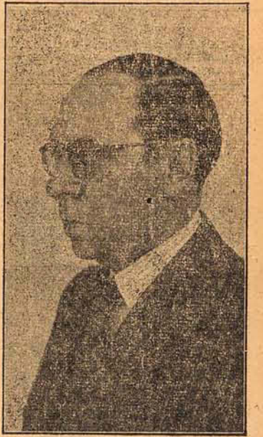
Interventor Nerêu Ramos

O presidente da Republica assinou um decreto concedendo autorização ao Estado de Santa Catarina para construção e exploração do porto de São Francisco do Sul.