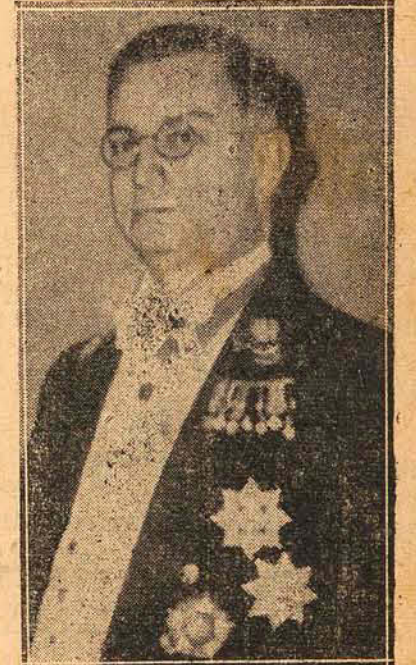
Gal. Francisco José Pinto

Assinalou o dia de ontem o aniversário natalício do General Francisco José Pinto, chefe do Gabinete Militar da Presidencia da Republica e Secretario do Conselho de Segurança Nacional. Figura de grande projeção social e vasto prestigio no seio do Exército Nacional, o ilustrado militar, pela sua fulgurante inteligência é uma expressão marcante na obra monumental que vem realizando o Estado Maior.