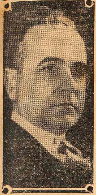
Presidente Getúlio Vargas