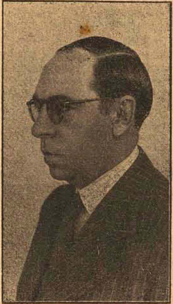
INTERVENTOR NEREU RAMOS