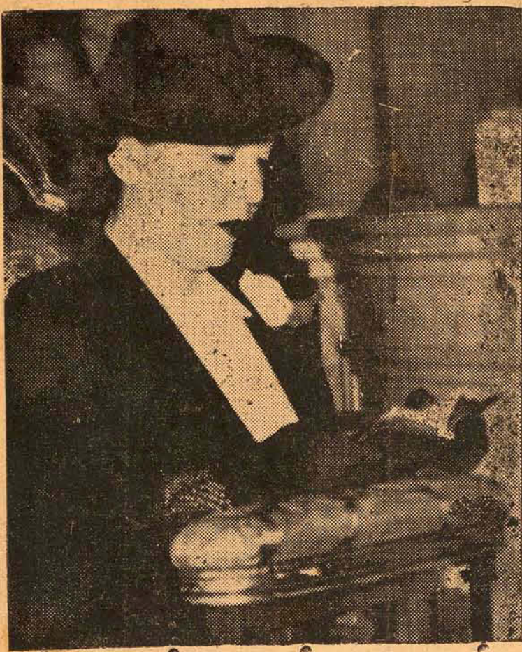
Senhora Darcy Vargas

FOSSE FORNECIDA COMIDA. IDEALISEI COISA MAIS OBJETIVA E DE RESULTADOS MAIS PRATICOS. O QUE VAI FAZER-SE E' ACOLHER AS CRIANÇAS DESPROTEGIDAS PARA EDUCALAS E TORNA-LAS DONAS DE CASA, COM APTIDÕES VARIAS, DE QUE SE UTILIZARÃO NA VIDA PRATICA. NÃO FALTARÃO NA "CIDADE DAS MENINAS", UMA FABRICA DE FIAÇÃO, UMA ESCOLA DE ENFERMAGEM, UMA USINA DE LATICINIOS, UMA OFICINA DE COSTURA E OUTRAS INSTALAÇÕES DE ENSINO PROFISSIONAL, QUE SERVIRÃO PARA PROPORCIONAR AS PEQUENINHAS BRASILEIRAS CONHECIMENTOS QUE AS LIVREM DA MISERIA E AS PRESERVEM DA DECADENCIA".