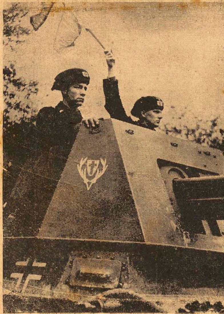
Os exercicios dos carros blindados de combate alemães. Nenhuma unica tropa gosa a doce "ociosidade"

RIO, 4 (A. N. Brasil) — Foi instalado hoje o Departamento de Serviço Público, recém-organizado nos moldes do DASP.