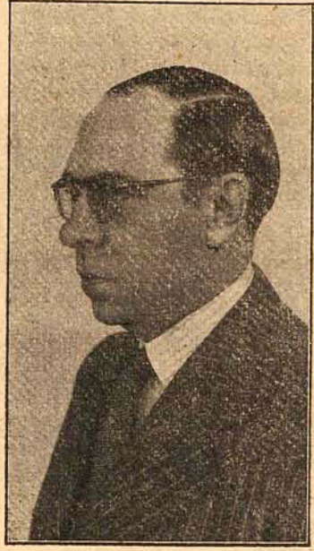
INTERVENTOR NEREU RAMOS