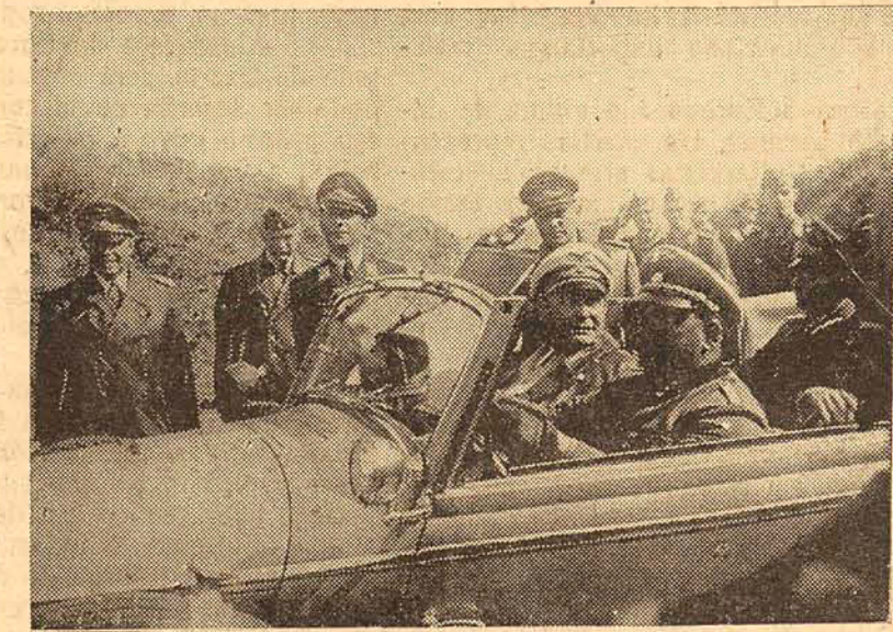
O MARECHAL DO REICH HERMANN GOERING, chete da Luftwaffe, sob cujo comando pessoal está a guerra aerea contra a Inglaterra, inspecionando posições na costa francesa.

BUKAREST, 21 (A.P. Norte-americana)—Um avião russo, conduzindo cinco oficiais da Força Aerea Sovietica, foi forçado a aterrisar em Constanta, pequeno porto onde ha uma concentração de tropas alemãs.