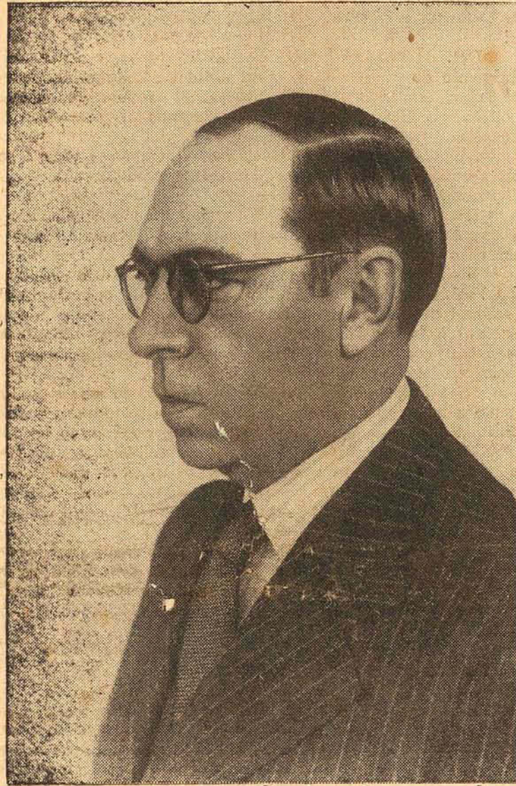
Interventor Nerêu Ramos

ANO VII | Florianópolis, 4a.-feira, 30 de Outubro de 1940 | NUMERO 1880