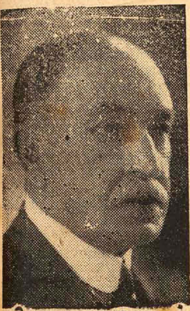
CORONEL VIDAL RAMOS

Quando, em 1935, o honrado conterrâneo dr. Candido Ramos, apresentou sua renúncia ao cargo de Senador Federal, coube a «A GAZETA», a honra, nessas horas de lutas e de incertezas, escudada na figura moral do eminente brasileiro, de em sua edição de 13 de julho desse mesmo ano, em "manchete", lançar aos catarinenses a candidatura de Vidal Ramos, nos seguintes termos: