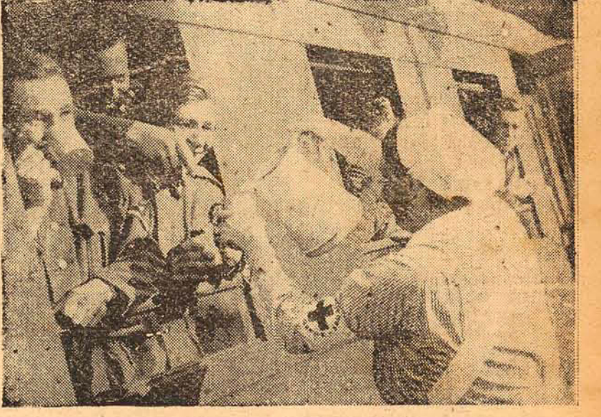
Soldados alemães em caminho ao front, recebendo café com leite das mãos de uma incansavel enfermeira da Cruz Vermelha