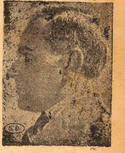
Presidente Getulio Vargas

BERLIM, 5 (Transocean, alemã)—Na incursão da noite passada, levada a efeito pelo inimigo, além dos aviões destruidos em terra perdeu a "Raf" cinco aparelhos derrubados nos combates aéreos. Cinco dos nossos aviões não regressaram ás suas bases.