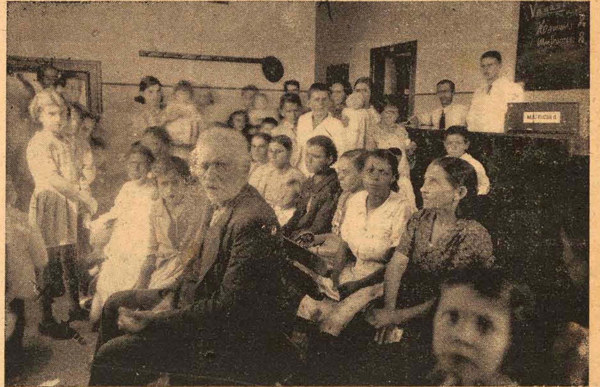
Aguardando o momento de serem atendidos pelos médicos