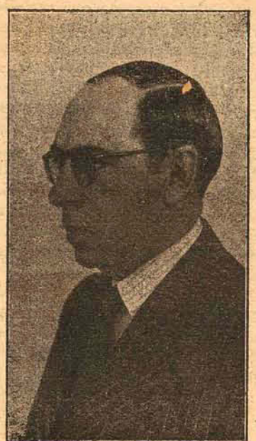
Interventor Nerêu Ramos.