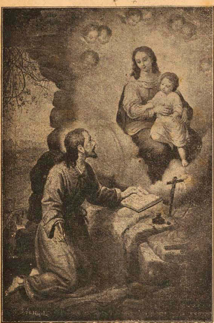
Santo Inácio de Loyola

Não podiam revestir-se de maior brilhantismo as cerimônias realizadas, ontem, comemorativas do IV Centenário da fundação da Companhia de Jesus, promovidas pelo Ginásio Catarinense.