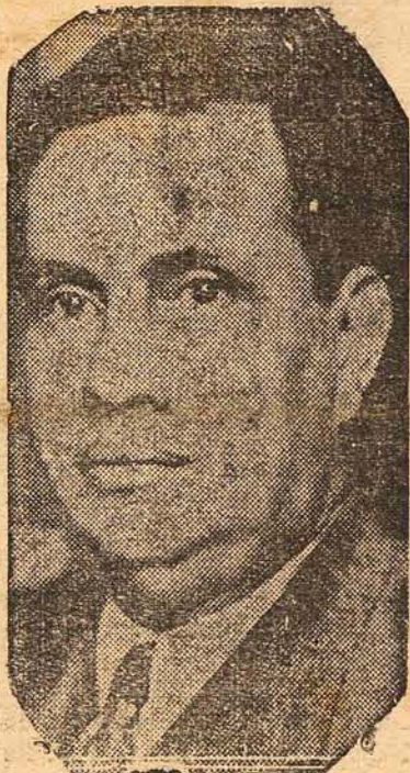
General Góes Monteiro

RIO, 24 (A. N. Brasil) —Assumiu a Chefia do Estado Maior do Exército o general Almerio de Moura, em substituição do general Góes Monteiro que seguiu para os Estados Unidos a bordo do URUGUAI.