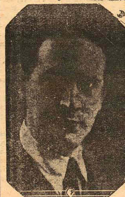
Ministro Osvaldo Aranha

RIO, 14 (A. N. Brasil) —Realizou-se no Itamarati a assinatura do Convenio de intercambio entre o Brasil e o Japão.