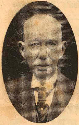
Ministro Matoso Maia Forte