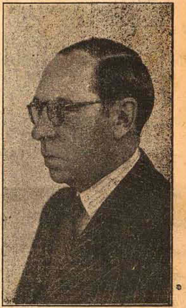
Dr. Nerêu Ramos

ANO VII Florianópolis, Sabado, 21 de Setembro de 1940 NUMERO 1847