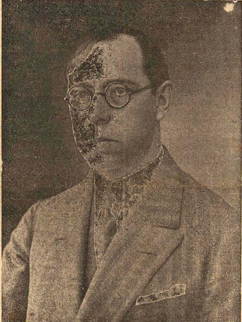
INTERVENTOR NEREU RAMOS

ANO VII Florianópolis, 4a.-feira, 18 de Setembro de 1940 NUMERO 1844