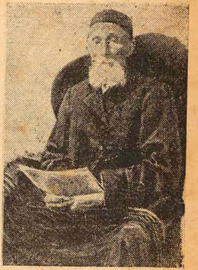
BLUMENAU nos últimos dias de sua vida em Brunswick

Gigantes da vontade, os colonizadores alemães ergueram em cada obstáculo que lhes antepunha á jornada de realizações grandiosas, mais um degrau que os conduziria á conquista da grandeza e do progresso da terra barriga-verde.