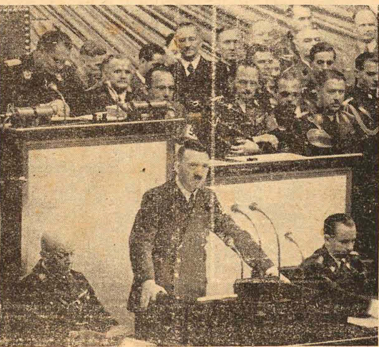
Hitler, falando no Reichstag