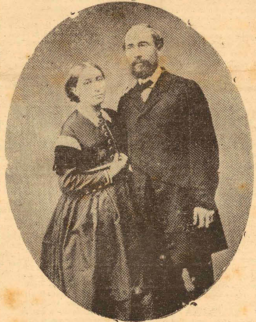
O doutor Blumenau e sua esposa Berta, por ocasião de seu casamento, em 1864

ções, momentos de confiança no futuro. Com efeito, em menos de dois lustros de atividades, a colônia por êle fundada prosperava a olhos vistos. Escasseavam, porem, ao seu fundador, os recursos mais urgentes para proseguir na obra encetada. Sem esperanças de auxilio da Prussia e contando, da Corte do Imperio, somente com promessas, o infatigável colonizador teve dias de desespero e desânimo. Mas nada o abateu. Alma sincera, idealista no verdadeiro valor da palavra, soube mostrar-se superior a tudo. Superior aos sacrificios que lhe impunham as incursões dos selvicolas, superior a destruição que aos colonos causavam as enchentes do Rio Itajaí, superior, principalmente, ás negras ingratidões de muitos daqueles a quem