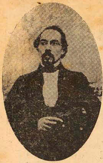
HERMANN BLUMENAU, na época em que chegou ao Brasil