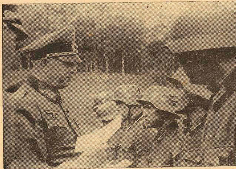
SOLDADOS DA ARMA AE'REA ALEMã RECEBEM DA MÃO DO SEU GENERAL O DOCUMENTO DA CONDECOORAÇÃO COM A CRUZ DE FERRO.

RIO, 15 (de Ceuta, Associated Press, ag. n. americana)—Noticias de Gibraltar informam que as torres do couraçado "Hood" foram seriamente danificadas, e não podem ser reparadas em Gibraltar.