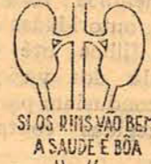
SI OS RINS VAO BEM A SAUDE É BOA

O uso do HELMITOL da Bayer é providencial para os rins; limpa-os e desinfeta-os, assegurando o bem estar presente e garantindo uma velhice sadia e sem achaques - uma velhice que se esqueça do numero dos anos.