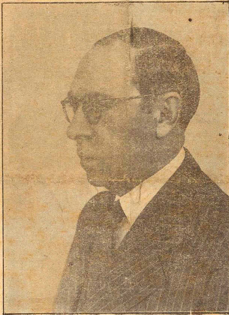
Interventor Nerêu Ramos

ANO VI | Florianópolis, 6a-feira, 3 de Maio de 1940 | NUMERO 1734