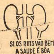
SI OS RINS VAO BEM A SAUDE É BOA

Cumpra recorrer ao HELMITOL assim que se manifestarem sintomas de perturbações renais - dores, urinas turvas e escassas, etc. A limpeza e desinfeccão dos rins com HELMITOL de Bayer é o caminho seguro para o bem-estar presente e a garantia de uma velhice livre de achaques.