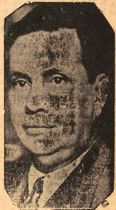
GEN. GÓES MONTEIRO

Tanto o "Petit Parisien" como o "Populaire" atribuem ao sr. Bonnet a intenção de submeter á Camara uma interpelação urgente encaminhada para derrubar o sr. Reynaud.