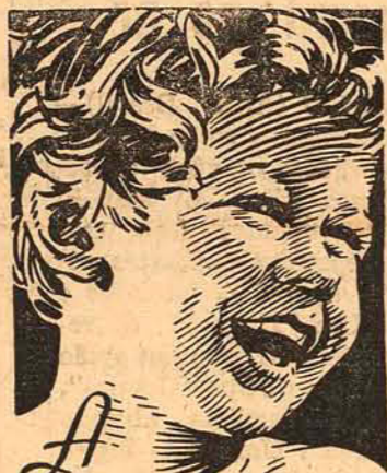
A carinha risonha

Não percam esta oportunidade de ver Wallace Beery medindo forças com Roberto Taylor os dois gigantes da expressão... E os beijos em Florence Rice? Que beijos!... De deixar voces todas, fans de BOB, com agua na boca... hoje no Cine REX. FAN.