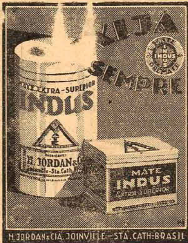
H. JORDAN & CIA. JOINVILLE—STA. CATH.—BRASIL

Indústria e Comércio Busato Ltda. — Caçador — Falta de pagamento de imposto — Julgado procedente o auto em face das informações e pareceres e imposta á autuada a multa de 26:966$000, ficando ainda obrigado ao pagamento por verba, do imposto de 13:483$000, bem como á selagem deste processo com selo da Taxa de Saúde.