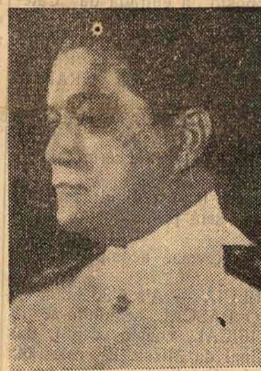
Ministro Aristides Guilhen

Em Florianopolis será remodelada a Capitania do Porto, e serão introduzidos diversos melhoramentos na Escola de Aprendizes Marinheiros.