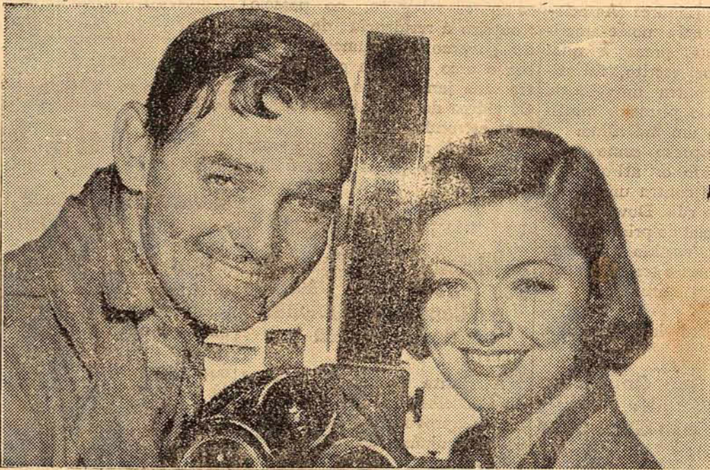
Sob os Céus dos Tropicos