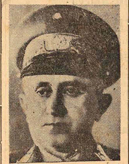
MINISTRO GASPAS DUTRA

RIO, 16—Seguirá no dia 22 para Recife o general Eurico Gaspar Dutra, ministro da Guerra.