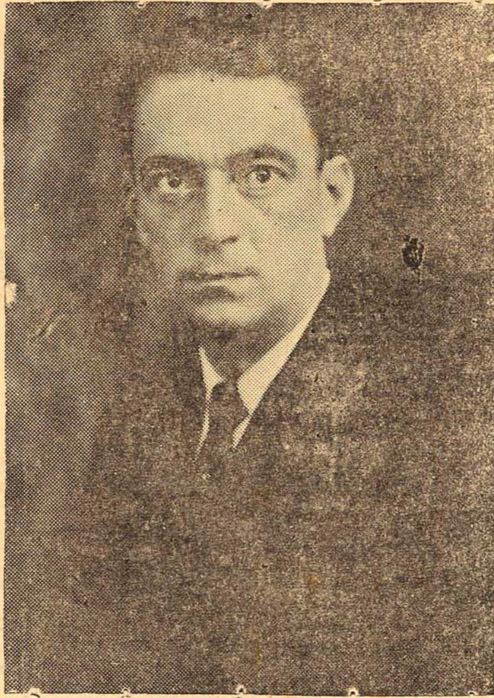
PREFEITO JOSÉ FERREIRA DA SILVA

A Prefeitura Municipal de Blumenau, está de parabéns pela existencia de um expressivo saldo no exercicio de 1939. De fato verificou-se uma receita arrecadada até 31|12|39 de 1.552.659$500 contra uma despesa realizada até a mesma data, de 1.376.647$070. O saldo foi, portanto, de 176.012$430 e é realmente vultoso em relação com o total orçado para 1939.