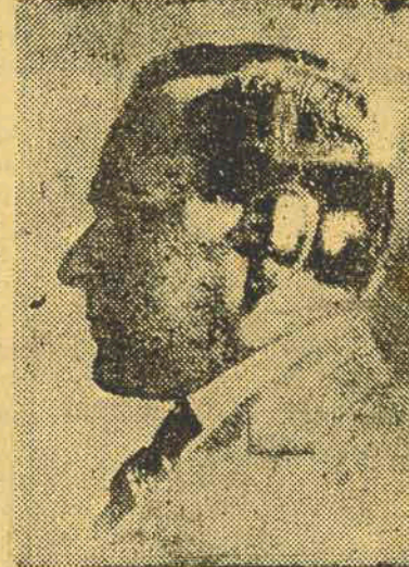
PRES. GETULIO VARGAS

Assinala-se que se trata do primeiro ato do sr. Getúlio Vargas, após o apelo em beneficio da maternidade e da infancia.