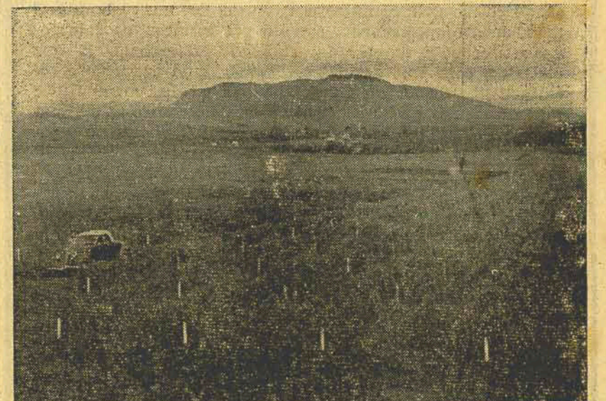
Outro aspecto dos trigaes da estação Fitotécnica de Lages