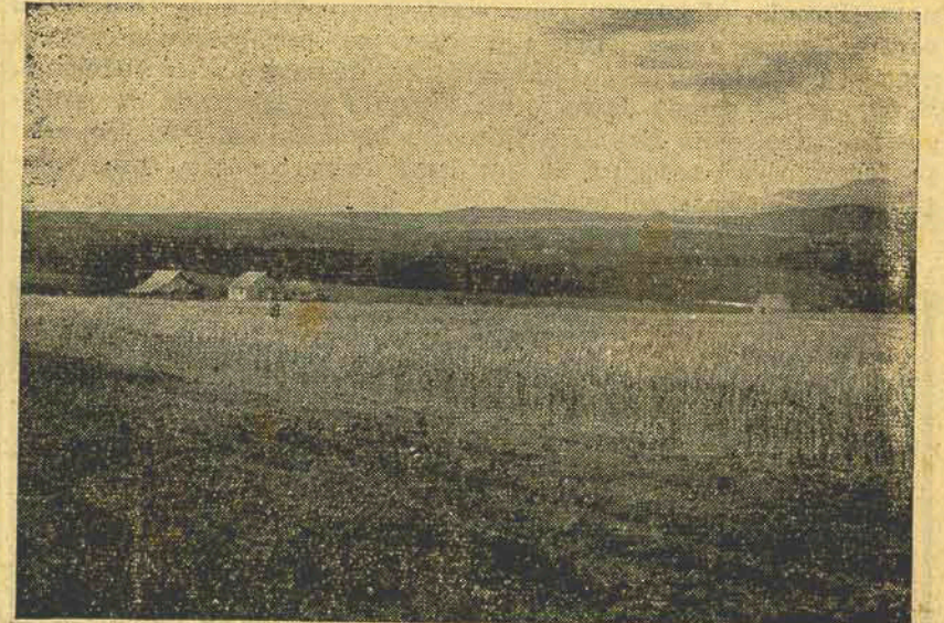
Trigo na estação Fitotécnica de Lages