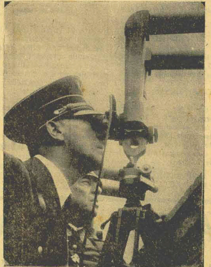
Hitler, observando por um telescópio, os movimentos militares.

Himmler afirmou, contudo, que Otto Strasser, antigo adversario de Hitler, organizou o atentado e o Intelligence Service forneceu o dinheiro. Além disto, foram detidos numerosos cúmplices de Elser. O comunicado afirma que Haya é a sede do departamento do ocidente europeu do Intelligence Service e que os agentes foram prêsos quando tentavam atravessar a fronteira alemã para a Holanda, a 9 do corrente, um dia depois do atentado de Munich. Os dois agentes britânicos foram prêsos em Venloo, na Holanda. Recorda-se que na mesma noite o governo holandês noticiou um idcidente em Venloo, no qual duas pessoas foram alvejadas e outras levadas para a Alemanha, pelos ocupantes de um automovel alemão, que as levou atravez da fronteira.