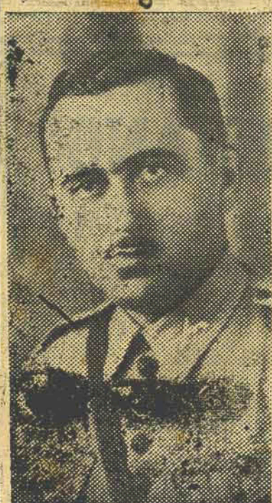
Prefeito tte. Leonidas C. Herbster

Jaraguá, que tem á sua frente, a incansavel atividade administrativa do prefeito tte. Leonidas C. Herbster, vai celebrar, no proximo dia 15 do corrente, a cerimonia do lançamento da pedra fundamental do novo predio destinado á Prefeitura.