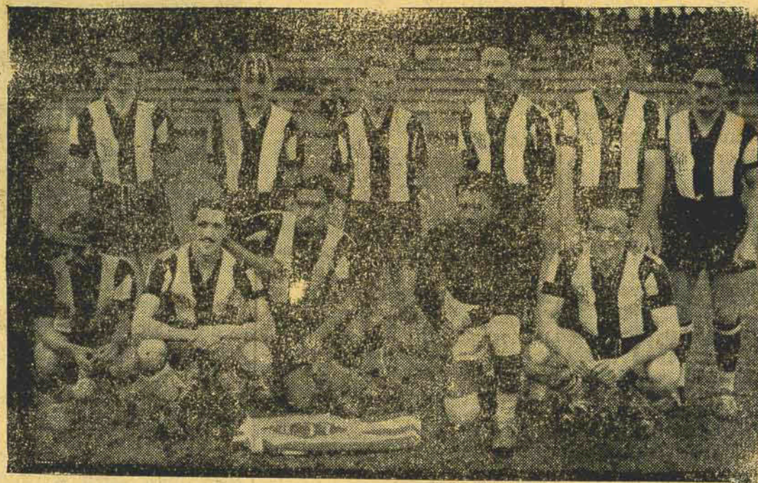
O combinado paranaense