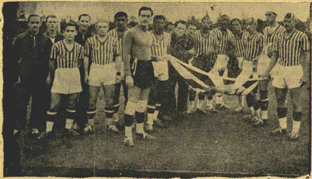
A seleção catarinense