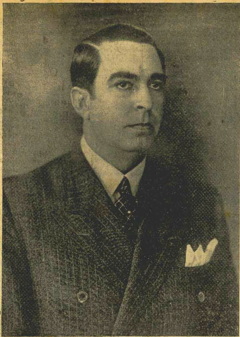
Prefeito Mauro Ramos

Administrar um município, no Brasil de hoje, não é mais aquela cômoda e regalada investitura de outros tempos, quando era permitido ao caciquismo garantir-se por determinado período numa poltrona administrativa, a coberto de qualquer satisfação séria sobre seus atos, e, não raro, á revelia da vontade popular, mal consultada num simulacro de eleição ou iludida no retumbante palavrado das plataformas.