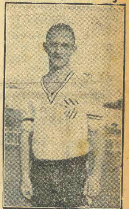
Calico o valoroso meia-esquerda alvi-negro

A's 13,45 horas, sob as ordens do arbitro Norberto Dutra da Silva, teve inicio a partida dos quadros secundarios, terminando ás 15,25, com a vitoria do Figueirense elo elevado escore de 5 a 2.