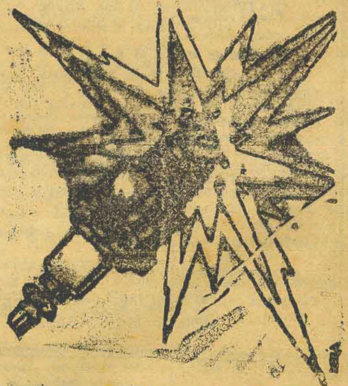
Do Fama Mundial