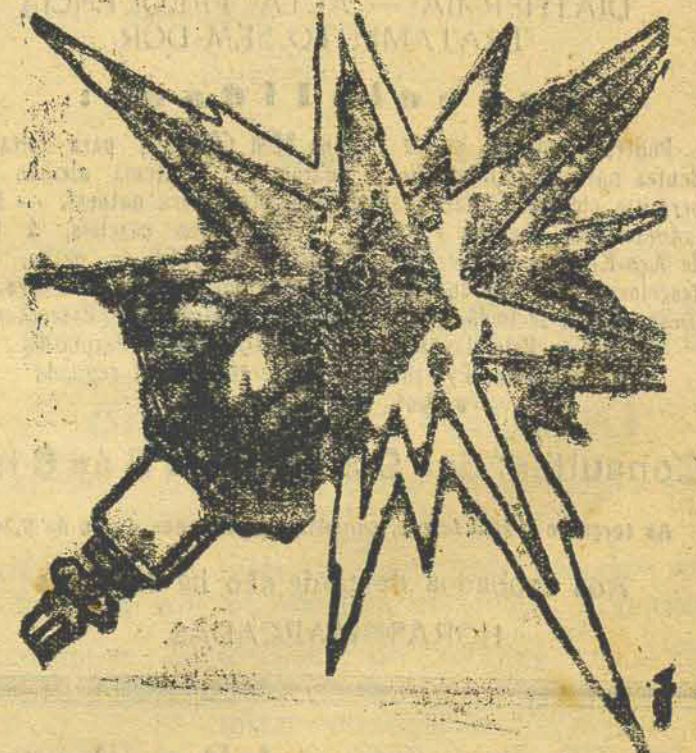
De Fama Mundial