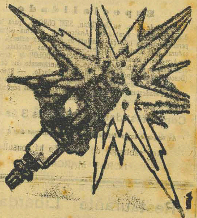
Do Fama Mundial