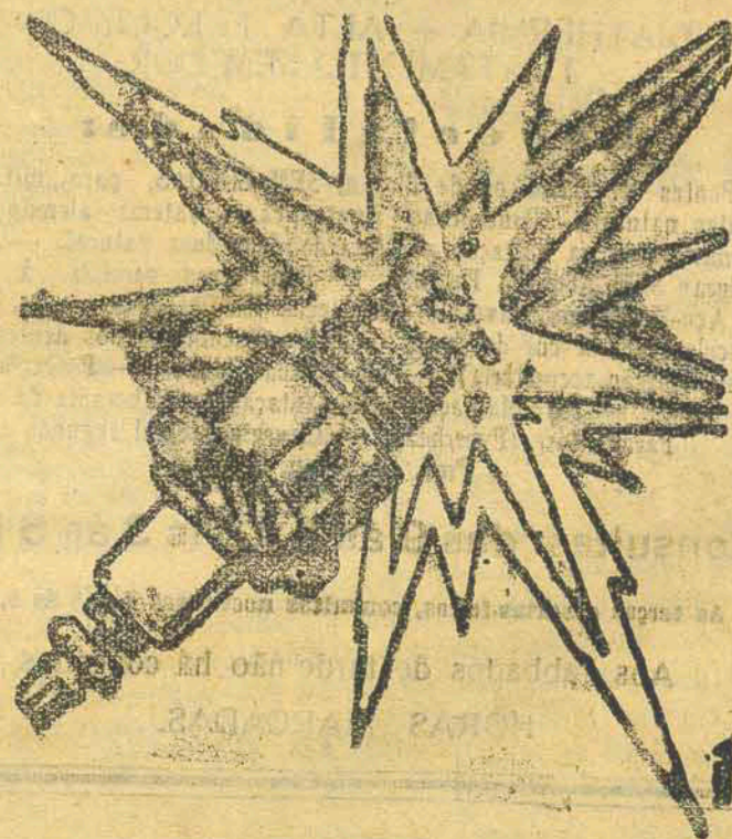
De Fama Mundial