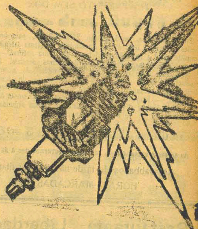
Do Famoso Mundial