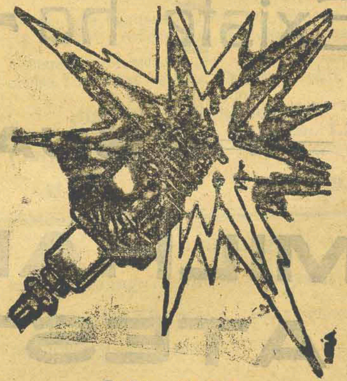
De Fama Mundial