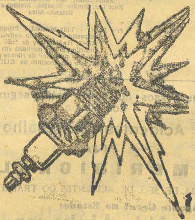
De Fama Mundial