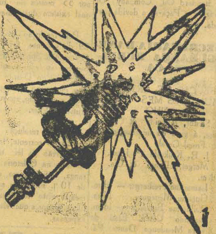
De Fama Mundial!