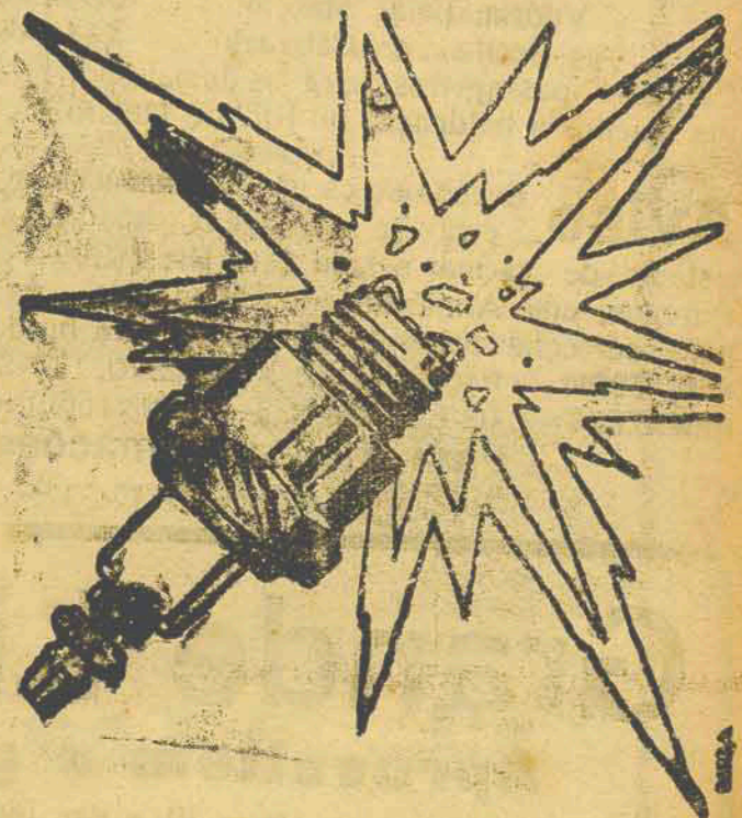
De Fama Mundial!