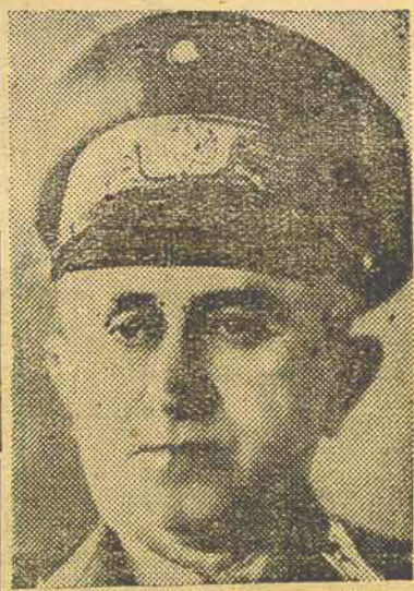
Gal. Eurico Dutra

RIO, 13 —O general Gaspar Dutra, ministro da Guerra, baixou um aviso, declarando que, diante da necessidade de colocar as reparações de motores de aviões sob a responsabilidade direta de um oficial engenheiro aeronautico e de orientá-las sob a direção superior do serviço técnico da Aeronautica, autorizou o diretor da Aeronautica do Exército a organizar, provisoriamente, um parque regional em S. Paulo, no campo do Marte, funcionando sob instruções especiais.